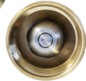
ME778 F. QCC